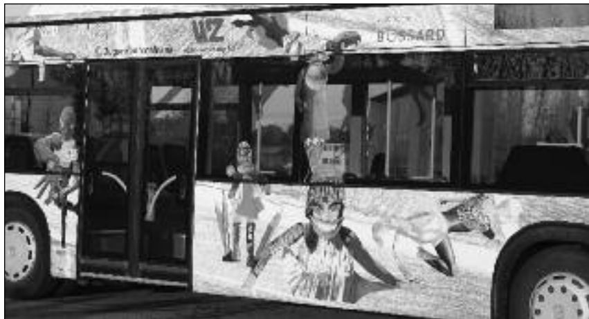
„Gemeinnutz statt Eigennutz“: Zu diesem Motto gestaltete eine Klasse der Kantonsschule Zug einen Gelenkbus der ZVB um.

durchschnittlich hohen Lebensstandards gibt es immer Menschen in Krisen- und Notsituationen. Mit den sozialen Projekten von GGZ@Work (Arbeitsprojekte für erwerbslose Menschen) konnte 1997 schnell und unbürokratisch der Arbeitslosigkeit entgegen gewirkt werden. Als jünger