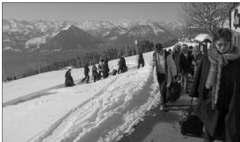
Die 21 Vorstandsmitglieder der Frauenzentrale Zug auf dem Weg zur ehrenamtlichen Arbeit (Retraite 2008 auf der Rigi).

Die Frauenzentrale – ohne freiwillig und ehrenamtlich Arbeitende undenkbar! – ist als Verein organisiert, parteipolitisch unabhängig und konfessionell neutral. In den letzten Jahren wurde eine "Renovation" der Organisationsstruktur nötig. Es entstand ein klares Leitbild, und die verschiedenen Engagements wurden deutlich unterscheidbaren Bereichen zugeordnet. Unter